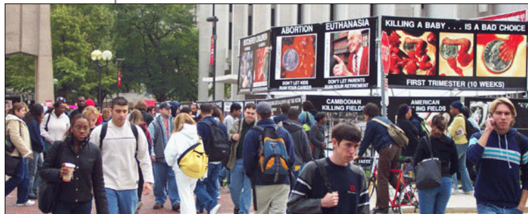
Temple University, octobre 2002. Un exemple de campagne GAP (Genocide Awareness Project) animé par le Centre de Réforme Bioéthique ( www.cbinfo.org ).

Ces tendances positives en Amérique nous concernent en Europe, où la culture de mort s'institutionnalise de plus en plus, parce que l'Amérique est un acteur majeur dans la question de l'avortement. En tant que seule grande puissance terrestre, elle exerce une très grande influence, dans un sens ou dans un autre ; ainsi depuis 40 ans, elle a soutenu les eugénistes, avec la complicité